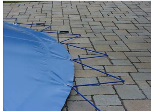
Eingebauter Pool mit Haken befestigt. Sicherlich die beste Möglichkeit, da die Plane ohne Seil in den Nieten schnell aufgerollt werden kann