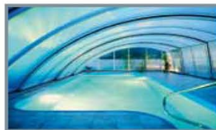
Maximale Überdachungsmaße B = 850; E = unbegrenzt